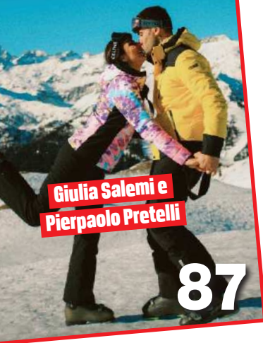
Giulia Salemi e Pierpaolo Pretelli