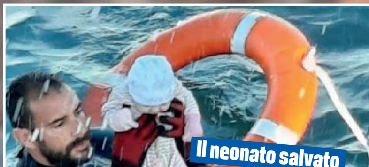
Il neonato salvato dal militare

L'allentamento dei controlli da parte del Marocco ha provocato una fuga di massa da parte di uomini, donne e bambini, che cercano di raggiungere l'Europa e una vita migliore