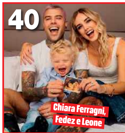
Chiara Ferragni, Fedez e Leone